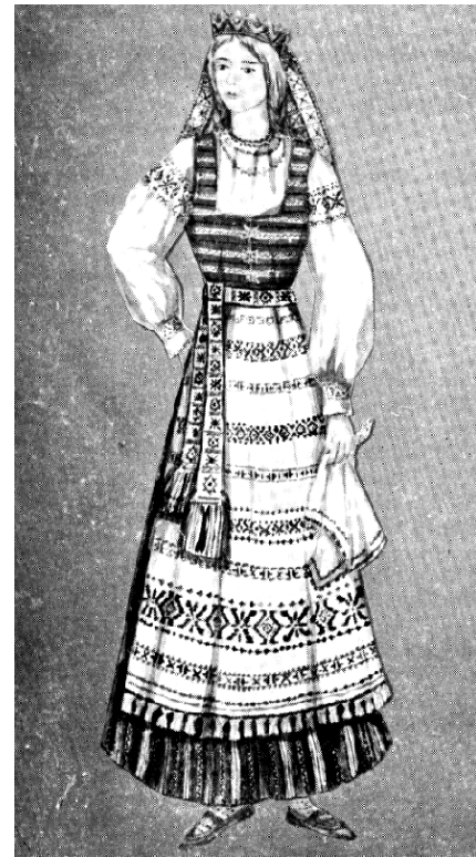
Mažosios Lietuvos mergaitė

Žemaičių tautiniai drabužiai įvairūs ne tiek raštais, kiek išilginiu dryžuotumu ir savitu spalvų derinimu.